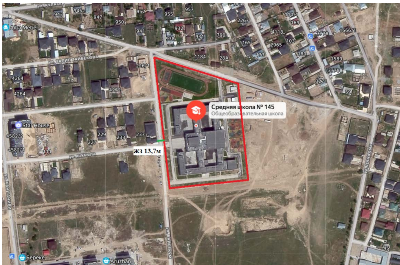
Рис. 1. Карта расположения предприятия, расположенное по адресу: г.Шымкент, мкр. Нуртас, 1303